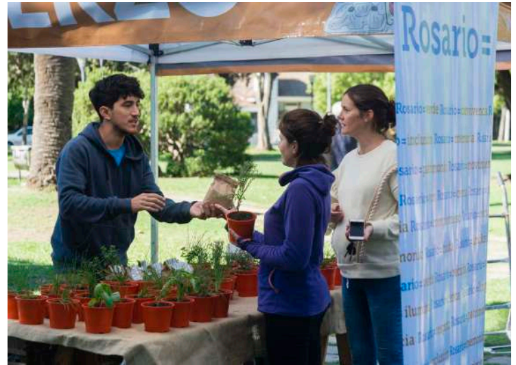
Predio de Bella Vista: Plantas de Tratamiento

➤ Canjes Saludables es una actividad itinerante que promueve la separación de residuos en origen, y que propone la reducción de la cantidad de desechos enviados a disposición final. Se realiza canjeando una bolsa de residuos reciclables por verduras o carga de tarjeta del sistema público de transporte. De este modo, se incentiva a la movilidad sustentable y al consumo de verduras orgánicas producidas por huerteros del Programa de Agricultura Urbana (PAU).