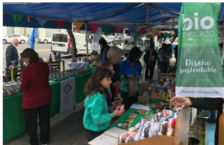
Mercados y ferias

Escuela de Emprendedores. Se brinda formación, desarrollo e impulso de emprendimientos mediante estrategias que permitan mejorar la gestión y elevar la calidad de los productos.