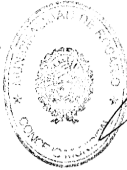
Miguel Zamario Presidente Concejo Municipal de Rosario