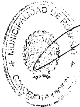
Cjal. Miguel Zamarini Presidente Concejo Municipal de Rosario